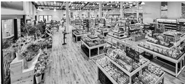
図IV-3-4 地産マルシェ「あさま市場」

https://www.kawaguchikobase.com 写真提供: 大伴リゾート