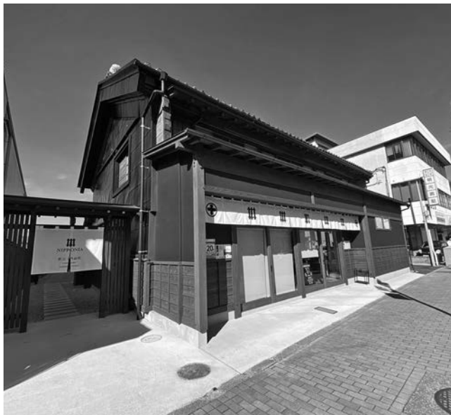
図IV-3-3 NIPPONIA 秩父 門前町

2022年8月、古民家3棟を宿泊施設やレストラン、カフェに再生させた分散型宿泊施設「NIPPONIA 秩父 門前町」が埼玉県秩父市で開業(図IV-3-3)。運営を行う「秩父まちづくり」は、西武リアルティソリューションズ、一般社団法人秩父地域おもてなし観光公社、NOTE、三井住友ファイナンス&リースが共同出資で設立した組織。築約100年の「マル十薬局」を改修したフロント棟「MARUJU棟」と、秩父神社参道の番通りに面する「小池煙草店」と「宮谷履物店」を改修した「KOIKE・MIYATANI棟」の2か所で構成されている。滞在を通じて地元の歴史や文化に浸ってもらうことで、秩父エリアの賑わい創出と持続的な地域活性化を目指す。